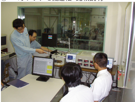
④エコポンプデモ機運転・比較説明