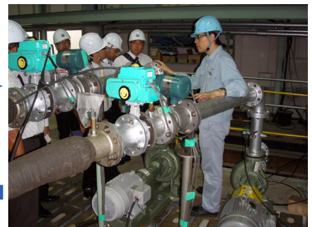
③エコポンプデモンストレーション機概要説明