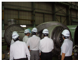
②工場案内 (大型ポンプ、ハイテクポンプ 実機説明)