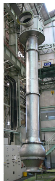
リビア向け 海水取水ポンプ