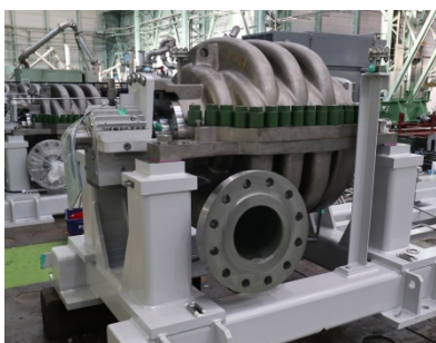
バーレン向け高圧海水供給ポンプ