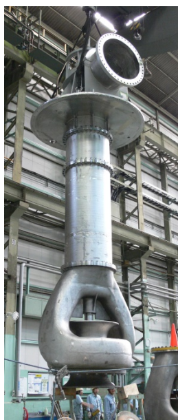
アラブ首長国連邦向け ブライン再循環ポンプ